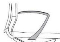
bracciolo fisso curvo