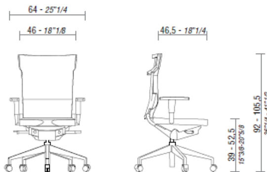
UNIQA, seduta con schienale in rete.