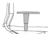
bracciolo a «T» regolabile in altezza