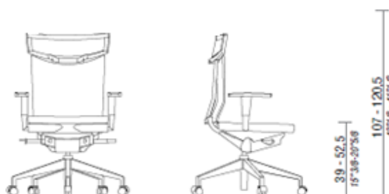
UNIQA, seduta con schienale imbottito (senza poggiatesta).